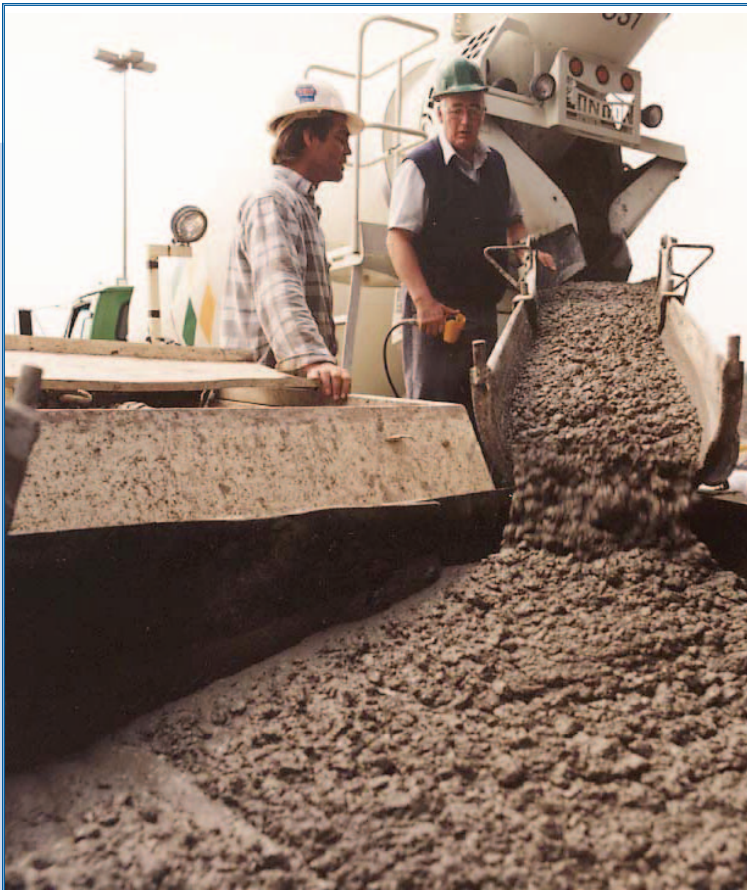
Coulée de béton