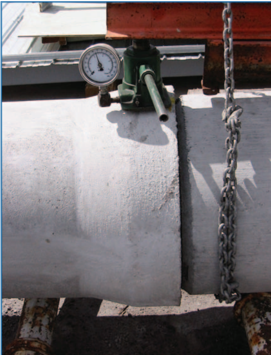
Essai sur tuyaux de béton

certifiés. Il y en a actuellement plus d'une centaine, répartis dans toutes les régions administratives du Québec.