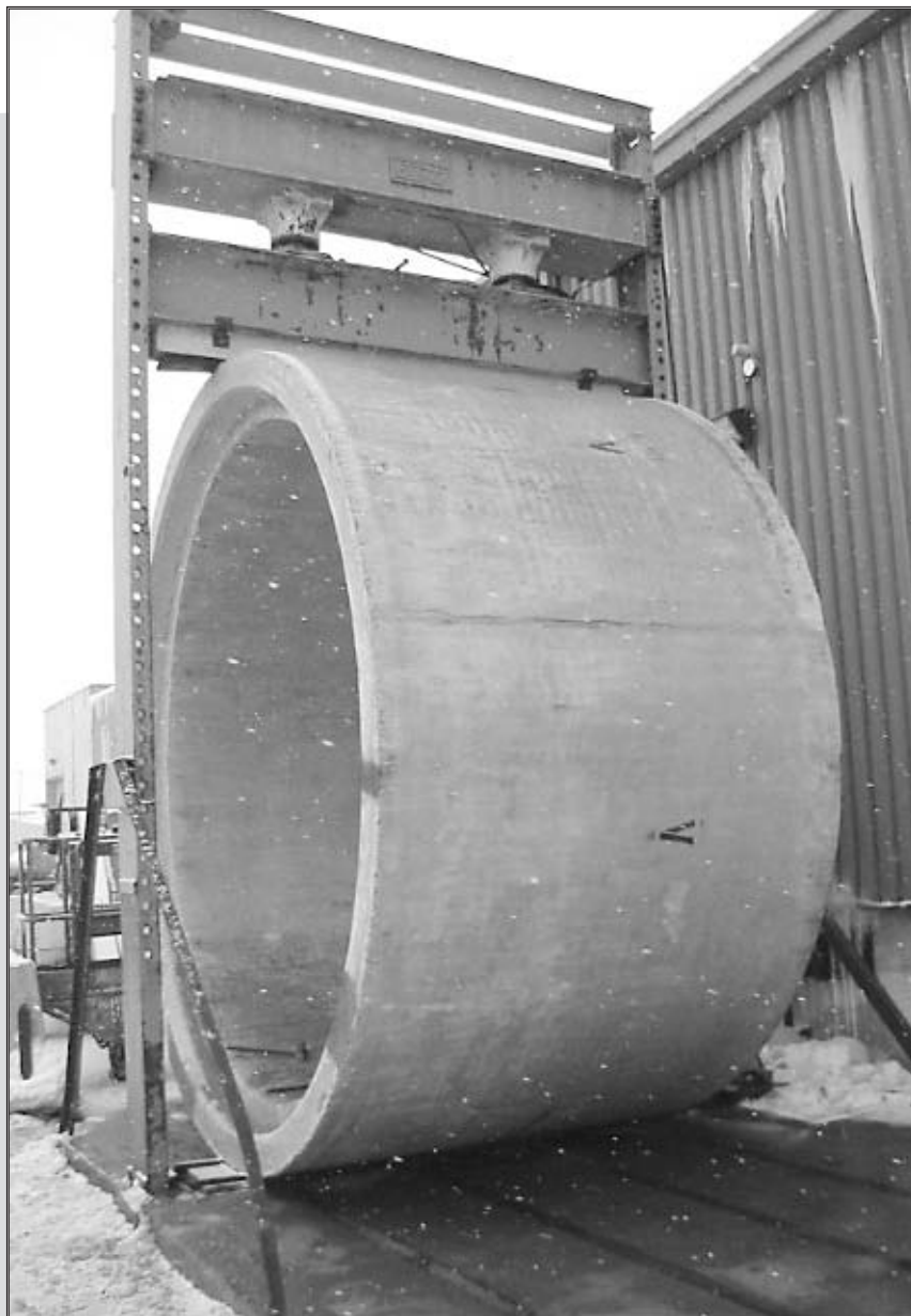
Essai sur tuyaux de béton