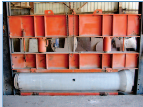
Essai sur tuyaux de béton

Le programme de certification des bétons prêts à l'emploi est offert par le BNQ depuis 1996. Il se réfère à l'ensemble des exigences et des règles issues de la norme NQ 2621-900 et du protocole de certification NQ 2621-905. Ce protocole précise les